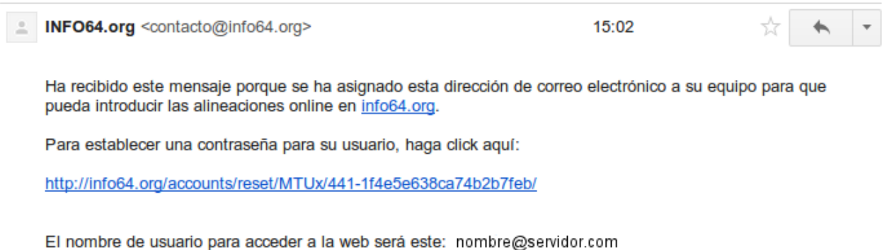
Imagen 1: e-mail introductorio para establecer contraseña

info64.org: usuario creado para introducir alineaciones