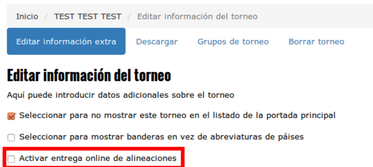
Imagen 4: Activar entrega de alineaciones online

En la pantalla de modificación de datos deberá activar la opción “Activar entrega online de alineaciones”: