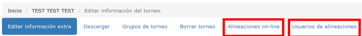
Imagen 5: Nuevas opciones de menú

Tras realizar eso, el menú de opciones se modificará y tendrá dos pestañas adicionales “Alineaciones on-line” y “Usuarios de alineaciones”: