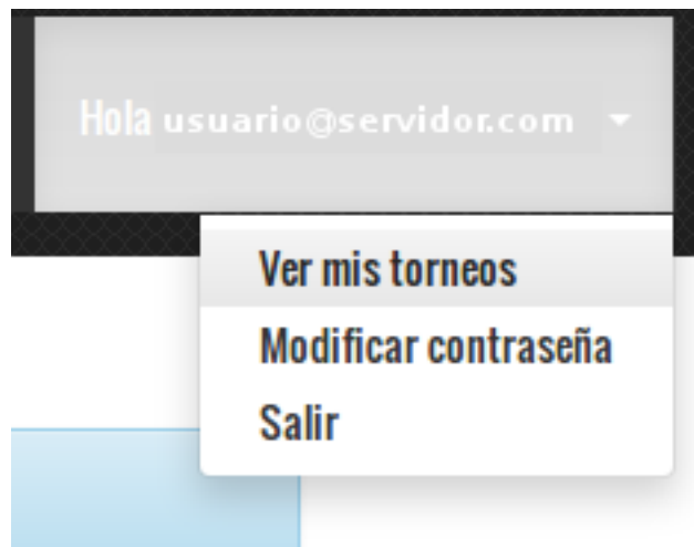
Imagen 2: Ver mis torneos

Al usuario se le mostrarán todos los torneos que ha subido a la plataforma en la que deberá seleccionar la opción “Modificar datos” del torneo en el que desee activar el sistema: