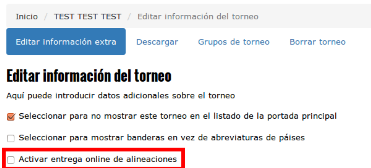
Imagen 4: Activar entrega de alineaciones online

En la pantalla de modificación de datos deberá activar la opción “Activar entrega online de alineaciones”: